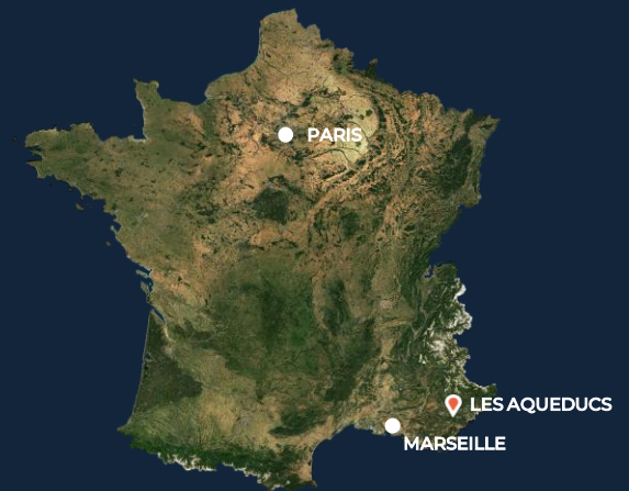
535 route des Lucioles 06560 Valbonne