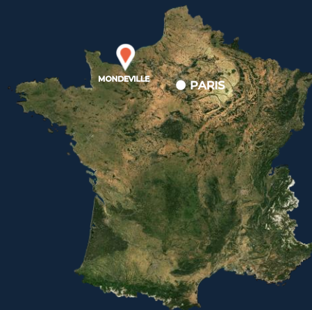
Chemin de la Cavée & Route de Paris - 14120 Mondeville